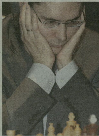
LÉKÓ EGYELŐRE HÁTRÁNYBAN

Ma közönségtalálkozó lesz 16 órától, majd szombaton és vasárnap újabb két-két rapidparti következnek.