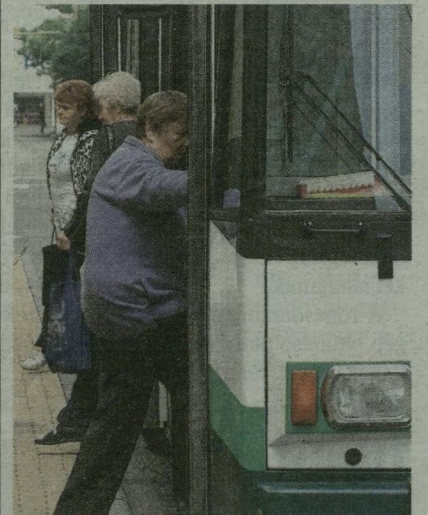
ELŐL FEL, HÁTUL LE