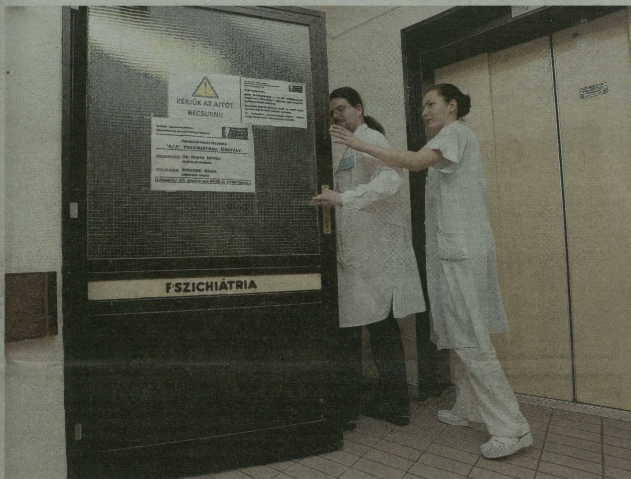
A TÁVOZÓK HELYÉBE KEZDŐ ORVOSOK LÉPTEK