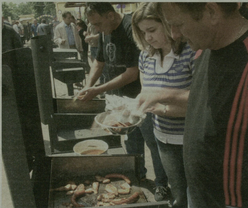
■ SZÁZ GRILLEZŐBŐL SZÁLLT A FÜST A MAKÓI NÁVAY LAJOS TÉREN