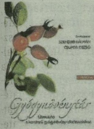
Gyógynövénytár A korszerű gyógynövény-alkalmazáshoz

A hazai könyvpiac egyedülállóan tekinthető kiadványt szerkesztett a Szegedi Tudományegyetem Farmakognózi Intézetének szerzőgárdája. A kötet tudományosan megalapozott ismereteket nyújt a gyógynövények értékeléséhez. A legfontosabb gyógynövényekről, amelyek a ma hatályos VIII. Magyar Gyógyszerkönyvben szerepelnek, szakirodalmi adatok feldolgozásával készült tanulmányok olvashatók. Számos olyan gyógynövényről is, amelyek hazánkban korábban nem voltak ismertek, napjainkban viszont egyre gyakrabban jelennek meg készítmények formájában. A több mint 150 gyógynövény lexikonszerű bemutatását gyakorlati szempontok szerint összeállított keresztreferencia-táblázatok egészítik ki. A kötet táblázatban rendszerezi az alkalmazási lehetőségeket, korlátokat, ellenjavallatokat. Az idegen szavakat, szakmai kifejezéseket szöveget magyarázza. A kötet nemcsak egészségügyi szakemberek számára nyújt munkájukhoz nélkülözhetetlen ismereteket, hanem azoknak az érdeklődőknek is, akik megbízható tények alapján kívánnak informálódni a gyógynövényekről, azok megalapozott alkalmazhatóságáról, valós helyükről a gyógyításban és az öngyógyításban.