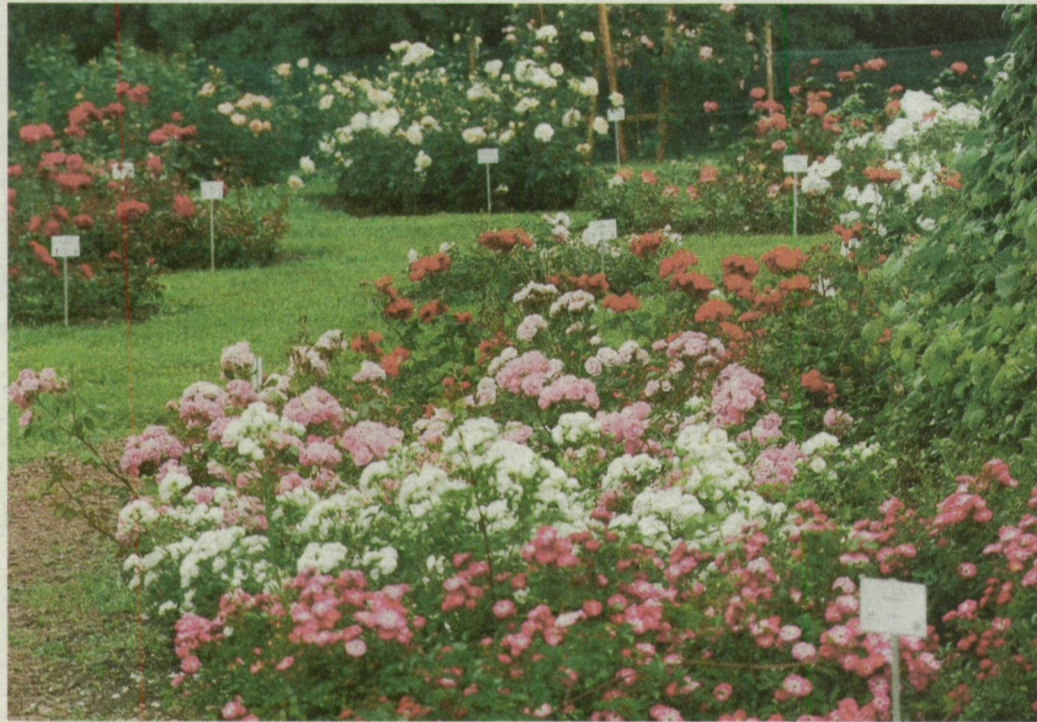
■ KÖZEL 130 FAJTA RÓZSA VIRÁGZIK AZ ÚJSZEGEDI FÜVÉSZKERTBEN