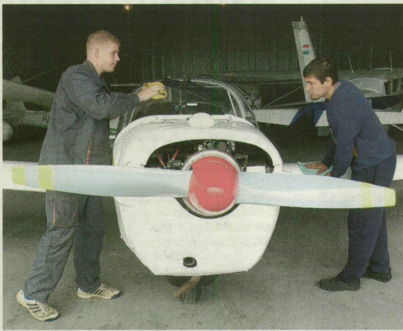
A HANGÁRBAN MÁR KÉSZÍTIK ELŐ A GÉPEKET