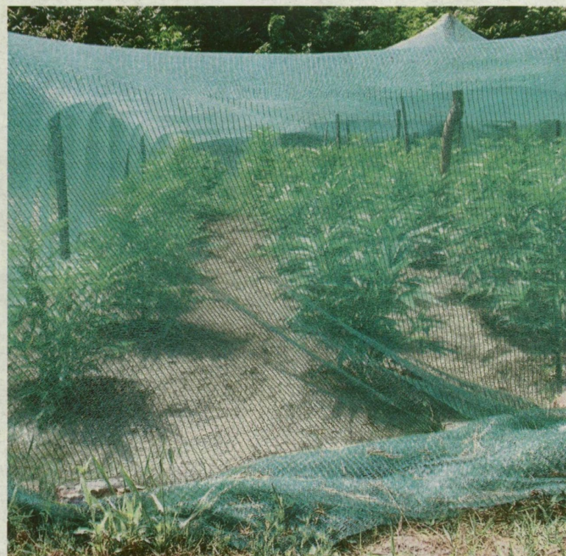
■ A KÁBITÓSZER-ÜLTETVÉNYEN 251 TŐ VADKENDER NEVELKEDETT