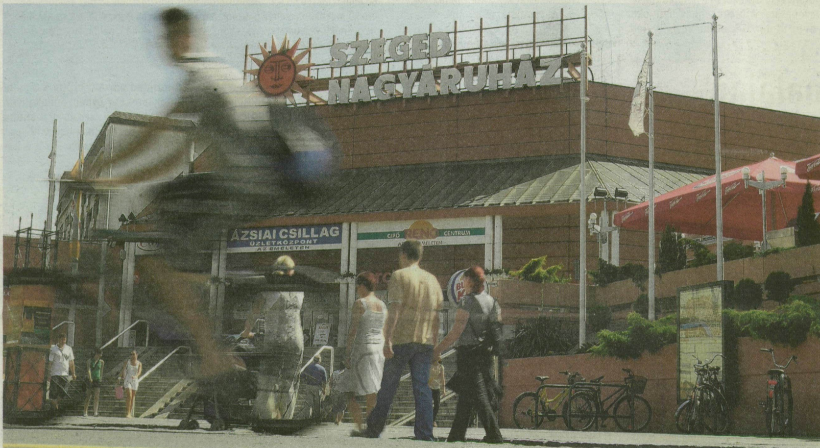
A „NAPSUGARAS” ÁRUHÁZBAN TÖBB MINT 30 BOLTOT TALÁLNAK A VÁSÁRLÓK