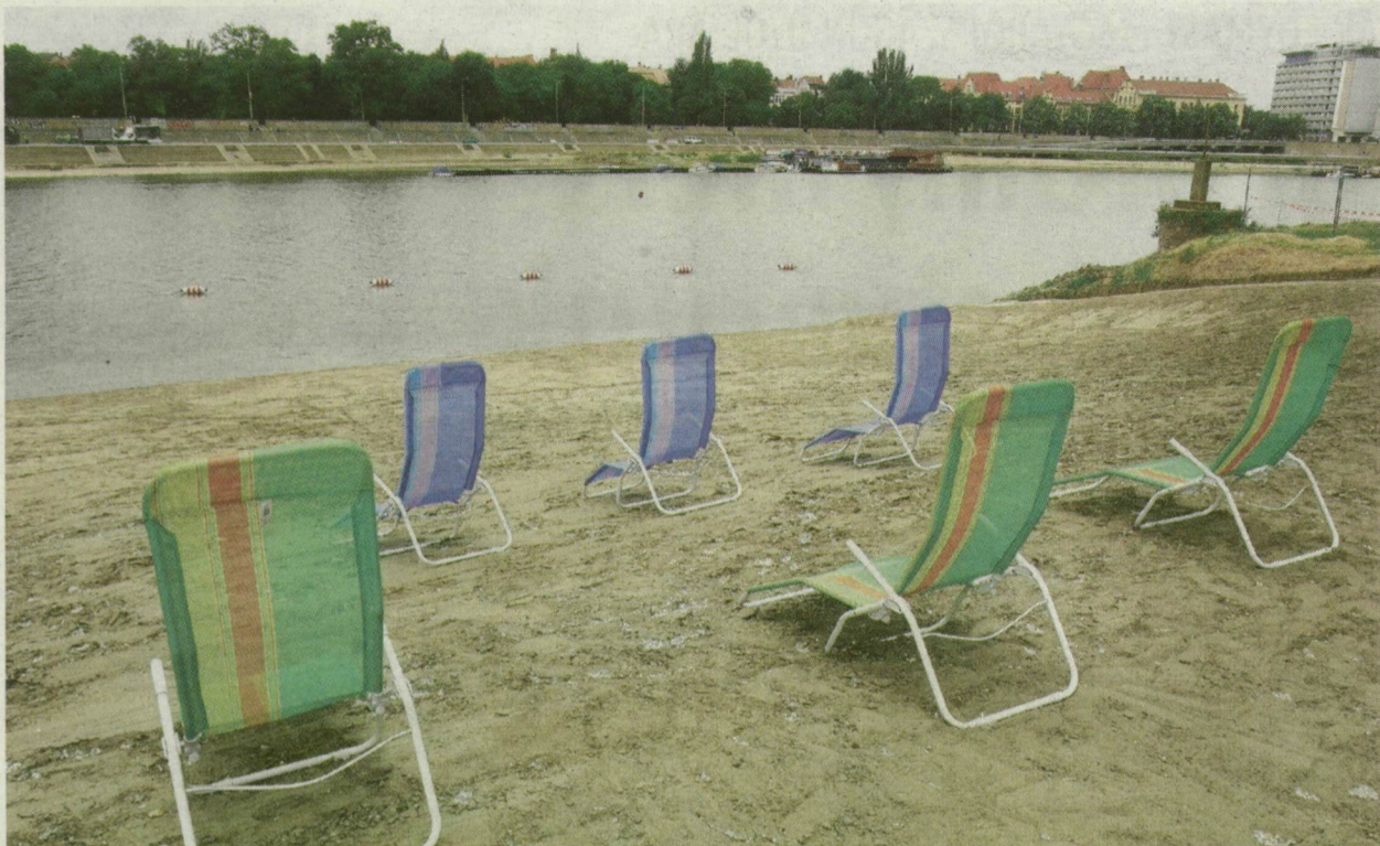
■ EGYELŐRE BŐVEN VAN HELY AZ ÚJ SZABAD STRANDON