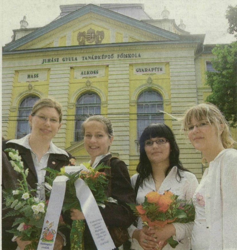
■ A VÉGZŐSÖK LEGTÖBBJE OPTIMISTA