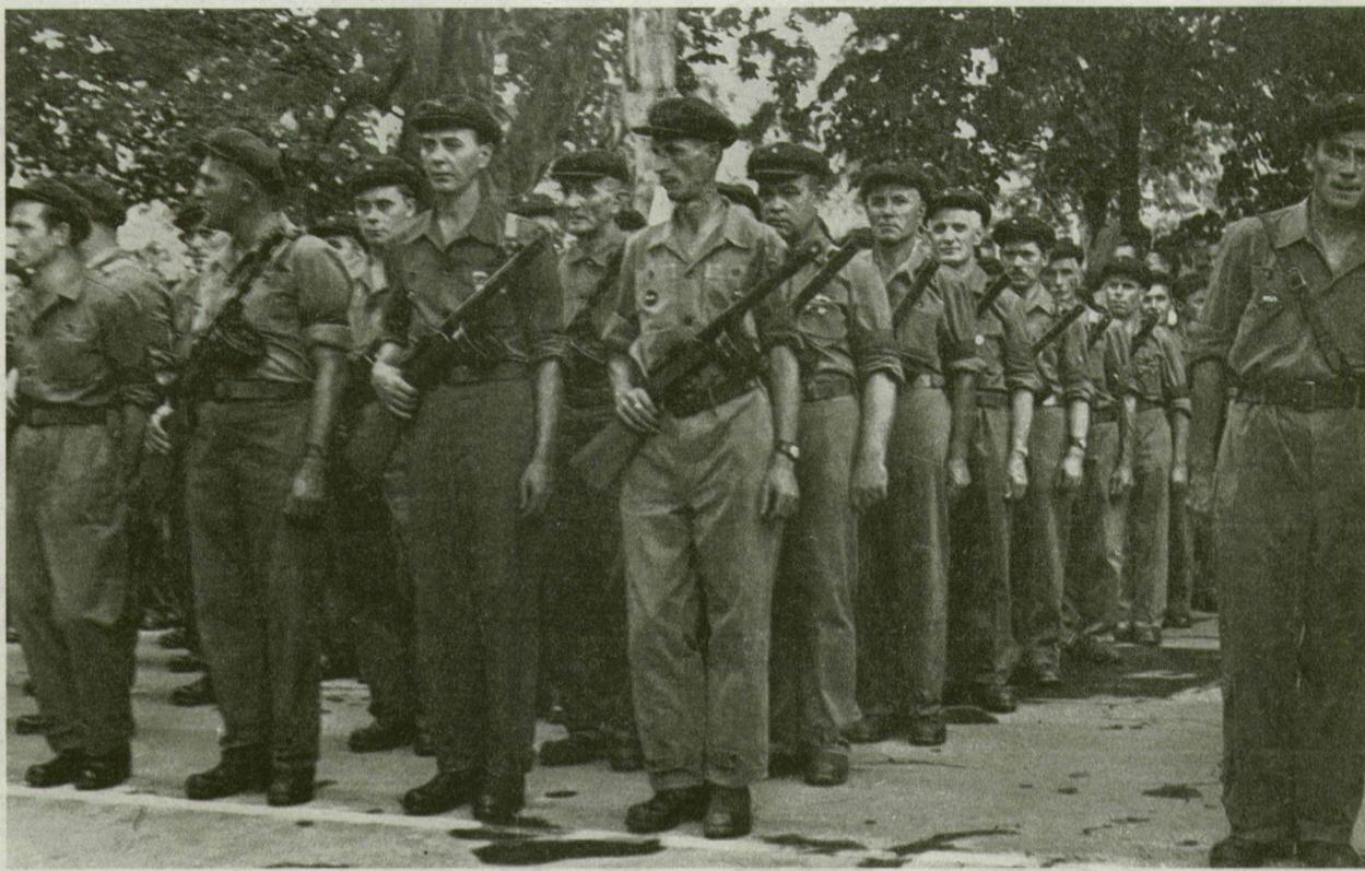
■ Immár a munkásöröket nevezik a forradalom katonáinak

„Az előállított személyek a Pedagógiai Főiskola első éves hallgatói: Ko-