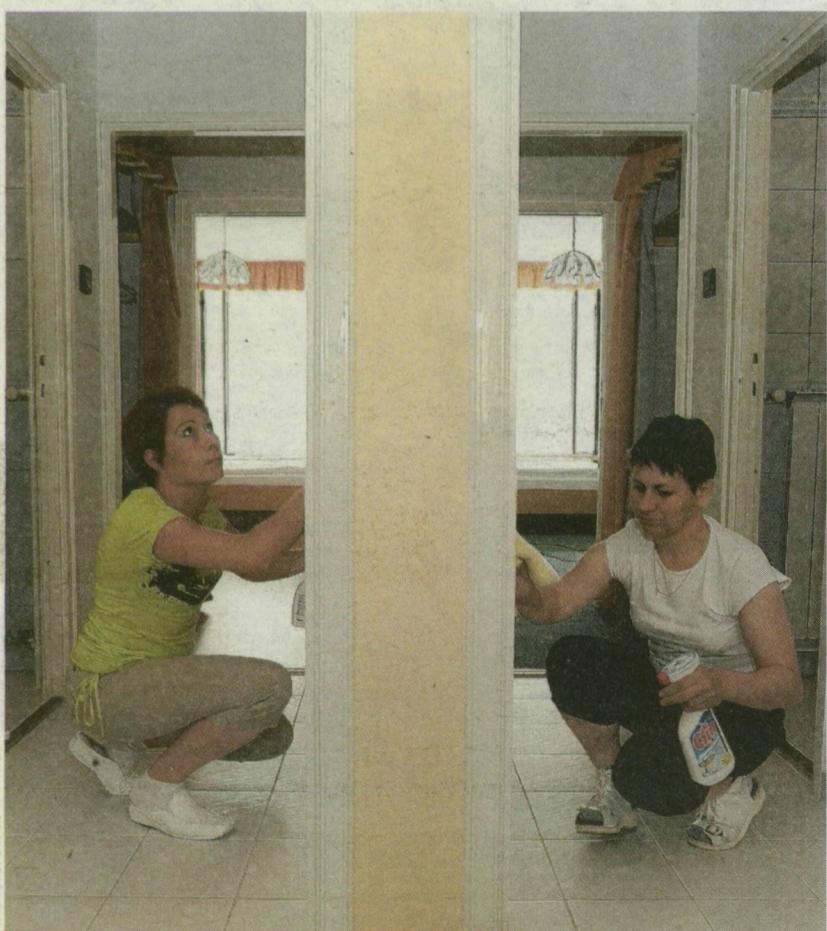
■ AZ ÚJ SZÁLLODASZÁRNYBAN MÁR A PÉNTEKI NYITÁSRA KÉSZÜLNEK