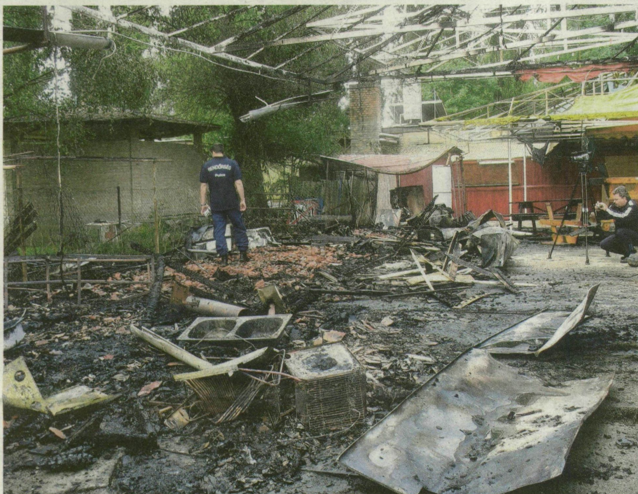
TÁJKÉP GYÚJTOGATÁS UTÁN. NÉGY PAVILON VÁLT A LÁNGOK MARTALÉKÁVÁ A CSONGRÁDI KÖRÖS-TOROKBAN