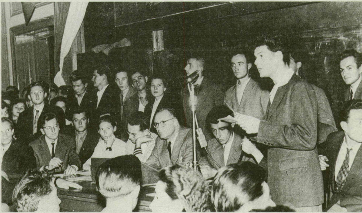
■ Szegedi egyetemisták október 16-án alakították meg a MEFESZ-t, az 1956-os forradalom első független szervezetét. Itt fogalmazták meg a követeléseket

„A szegedi egyetem és főiskola hallgatói kedden este az Ady téri egyetem nagy előadótermében nagygyűlést tartottak. A gyűlésen mintegy másfél ezer hallgató vett részt. A vita eredményeként új ifjúsági szervezetet alakítottak a Magyar Egyetemisták és Főiskolások Egységes Szövetségét, a MEFESZ-t, illetve annak szegedi szervezetét, amely a DISZ mellett működik, majd az alakuló ülés tömeggyűléssé változott át. A fiatalok élesen bírálták az idegen nyelvek, a marxizmus-leninizmus, a honvédelem tanításának mai formáját és rendszerét, ezenfelül elhatározták, hogy a politikai élet