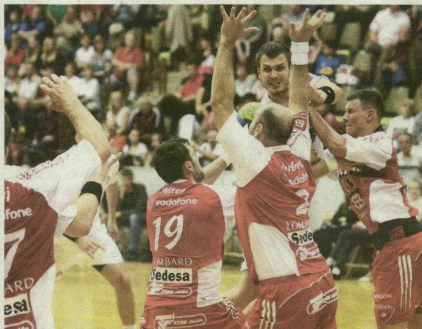
MUNKÁBAN GREBENÁR ELLEN A PIROS MEZES SZEGEDI VÉDELEM

Igazi pankráció zajlott, a hazaiak nem mentek a szomszédokba egy-egy brutális ütést. Kitalálhatják: csinálhatták, mert nem büntették. Az utolsó tíz perc háromgólos Dunaferri-előnyvel kezdődött (24-21). Katzirz kapta el a fonalat, 24-23-ra hozta fel csapatát, majd Oszmajics ziccerből egyenlített. Ghionea találata után, másfél perccel a vége előtt először vezetett a Pick, 26-25. Puljezevics meg-