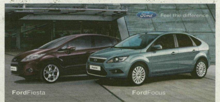
■ JÓ AUTÓK, JÓ KONSTRUKCIÓVAL

A FORD NÉMETORSZÁGI GYÁRA NEM VÁRT AZ ÁLLAMI DÖNTÉSRE Szegeden is megjelent a roncsautó prémium!