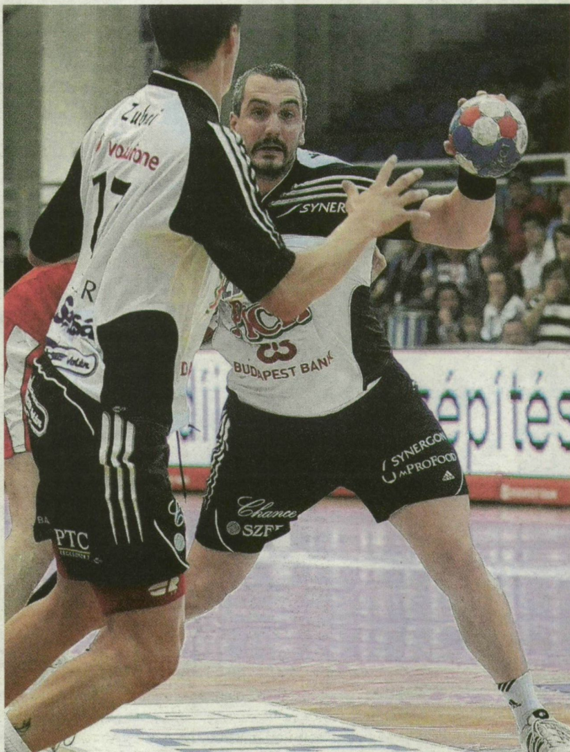
■ KRIVOKAPICSA (LABDÁVAL) SEM LEHETETT PANASZ, JÓL JÁTSZOTT

A második félidőre megszólaltak a szegedi nézők. Végre meccshangulat lett, zengett a „Pick Szeged! Pick Szeged!” biztatás. A játékosokra ez jó hatással volt, a 35. percben a meccs kezdéséhez hasonlóan ismét három góllal vezetett a Pick, 16-13. Brutális ritmusra