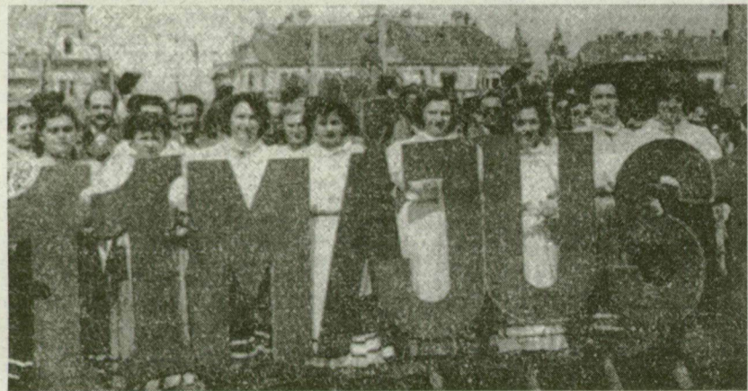
■ „A MEZŐKER dolgozói a felvonuláson, élen a kultúr csoport tagjaival, akik a 11. szabad május 1-jét köszöntő hatalmas betűket viszik”

teremtésének élharcosa, a dicső magyar munkásosztály!” „Éljen és erősödjön a megbonthatatlan munkás-paraszt szövetség!” „Éljenek a testvéri kommunista pártok, a béke, a demokrácia és a nemzeti függetlenség élharcosai!”