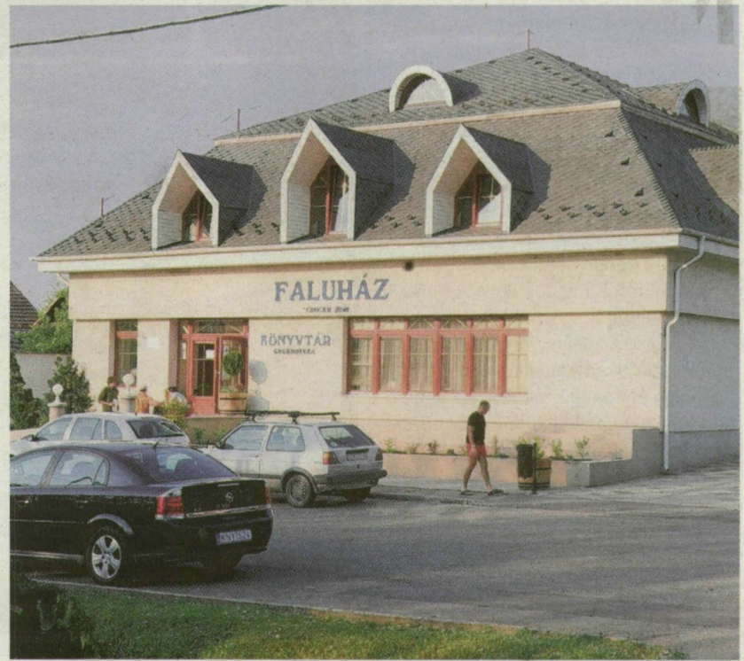
■ A FALUHÁZ ADOTT OTTHONT A TALÁLKOZÓNAK

A deszkiek fegyelmességét említette negyedikként a polgármester. – A lakosok megértették, hogy fontos az utca, a saját környezetük tisztán tartása, gondozása. Különösen fontosnak tar-