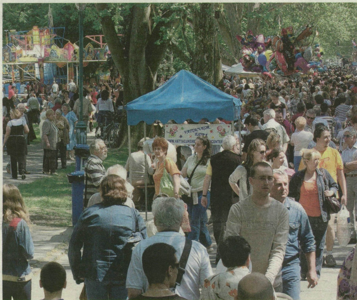
HAGYOMÁNYOSAN „TELT HÁZ” VOLT TEGNAP A SZEGEDI MAJÁLIS FŐ HELYSZÍNÉN, AZ ÚJSZEGEDI LIGETBEN