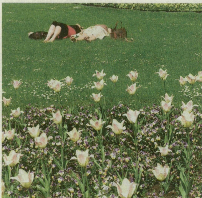
TAVASZI SZIESZTA A SZÉCHENYIN - Nem csak a virágok sütkéreznek a szegedi Széchenyi téren. A tavaszi napfény a lányokat is kicsalta a gyepre, a fűben heverve élvezik a kellemes időt.

HALAK (II. 21. – III. 20.): Egy találkozásra kell részt vennie. Ha ki is próbál bújni alóla, nem fog menni. Talán csak egy általános orvosi vizsgálatot dimenzionál túl.