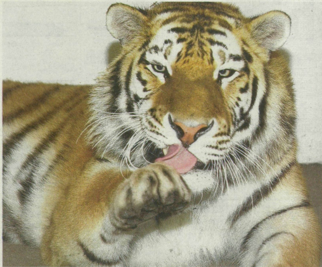
■ PEDRO NYUGTATÓINJEKCIÓ NÉLKÜL TÜRTE A HOSSZÚ UTAT