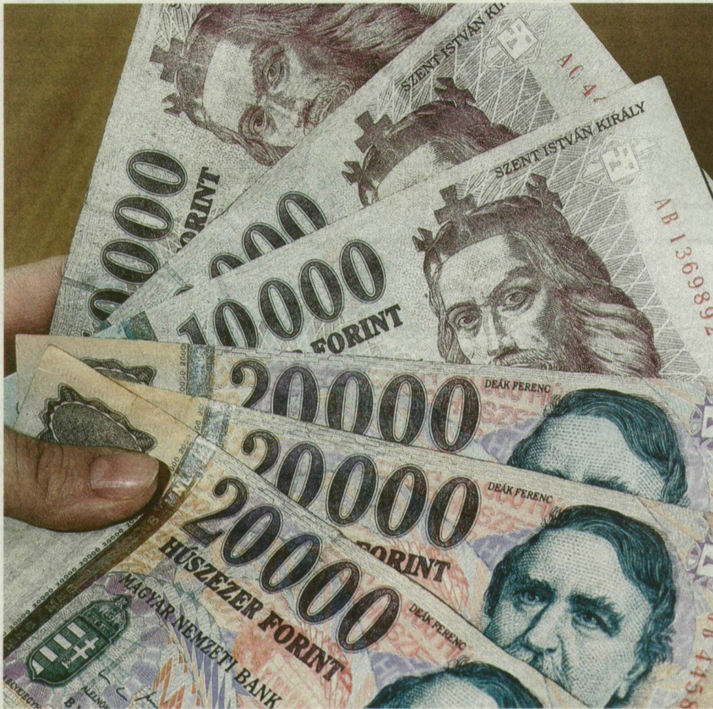
Forintbankjegyek. A devizahitelt is a gyenge magyar fizetőeszközzel kell törleszteni