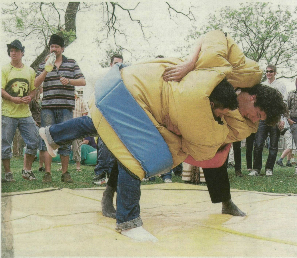
A DIÁKOK PUFFOS GUMIRUHÁBAN KÜZDÖTTEK