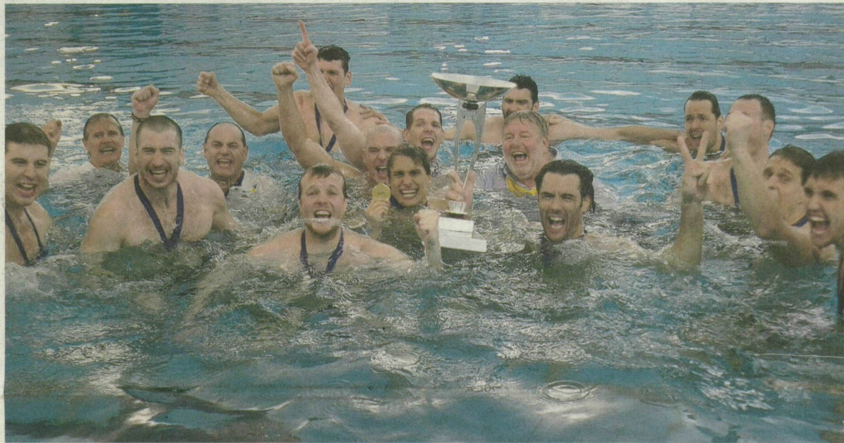
A BOLDOGSÁG PILLANATA. A SZEGED BETON GYŐZTES VÍZILABDACAPATA A LEN-KUPÁVAL AZ ÚJSZEGEDI SPORTSZODA ARÉNÁJÁBAN