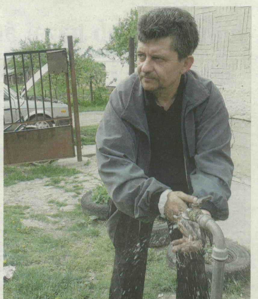
ANC SIN JÁNOS MÁR KÉSZÜL AZ ÉLETMENTŐ MŰTÉTRE