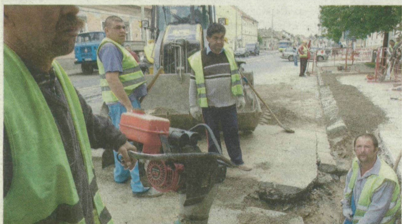
A NYÁRI FORGALOMELATERLÉSEKET ELŐKÉSZÍTVE A GÁZCŐSJAVÍTÓK MÁR DOLGOZNAK A KÁLVÁRIA SUGÁRÚTON