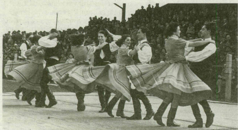
■ A néptánc-bemutató a tömegrendezvény tartozéka

a nagy sikert aratott Buljba című táncuk csak egyszerű krumpliültetést ábrázolt. Ez adta meg a tápeiaknak azt a gondolatot, hogy munkájukat elevenítsék meg. Így született meg az azóta nagy sikert aratott Sodrófonó című népi játékkuk, amely az apáról fiúra szálló mesterségét, a gyékényszövést mutatja be. (...) A szovjet tapasztalatok hasznosításával megerősödött, most már 120 tagú együttes nagy lelkesedéssel készül a megyei bemutatóra.”