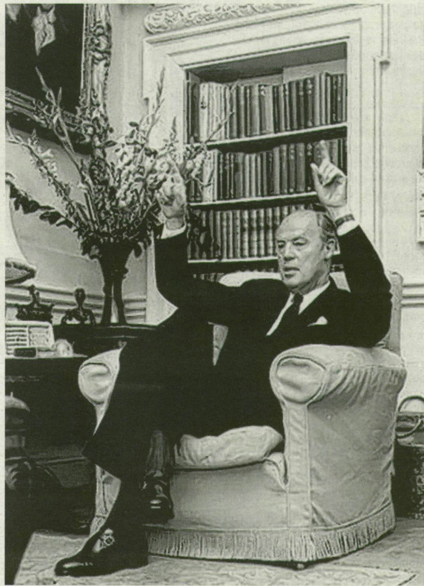
Esmond Cecil Harmsworth a vadászatnak nagy barátja volt

„Nagyságos Bába Károly kapitány úrnak! Mélyen tisztelt uram!” - áll a megszólításban. Az 1928. május 22-én kelt levél így folytatódik: „Hálásan köszönöm azt a kedves ajándékot, amellyel engem megtisztelt. Mint a vadászatnak nagy barátja, mindenkor