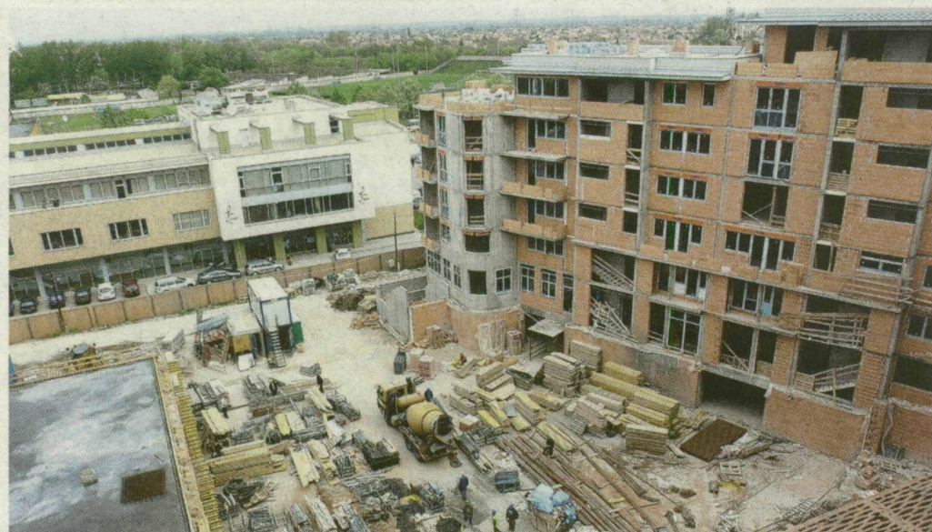
■ HAMAROSAN ELKEZDIK A BELSŐ UDVAR PARKOSÍTÁSÁT