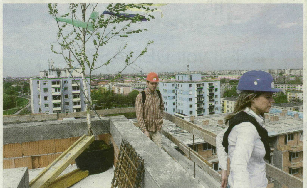
■ PANORÁMA A PALOTA TETEJÉRŐL – ZÖLDÁGGAL