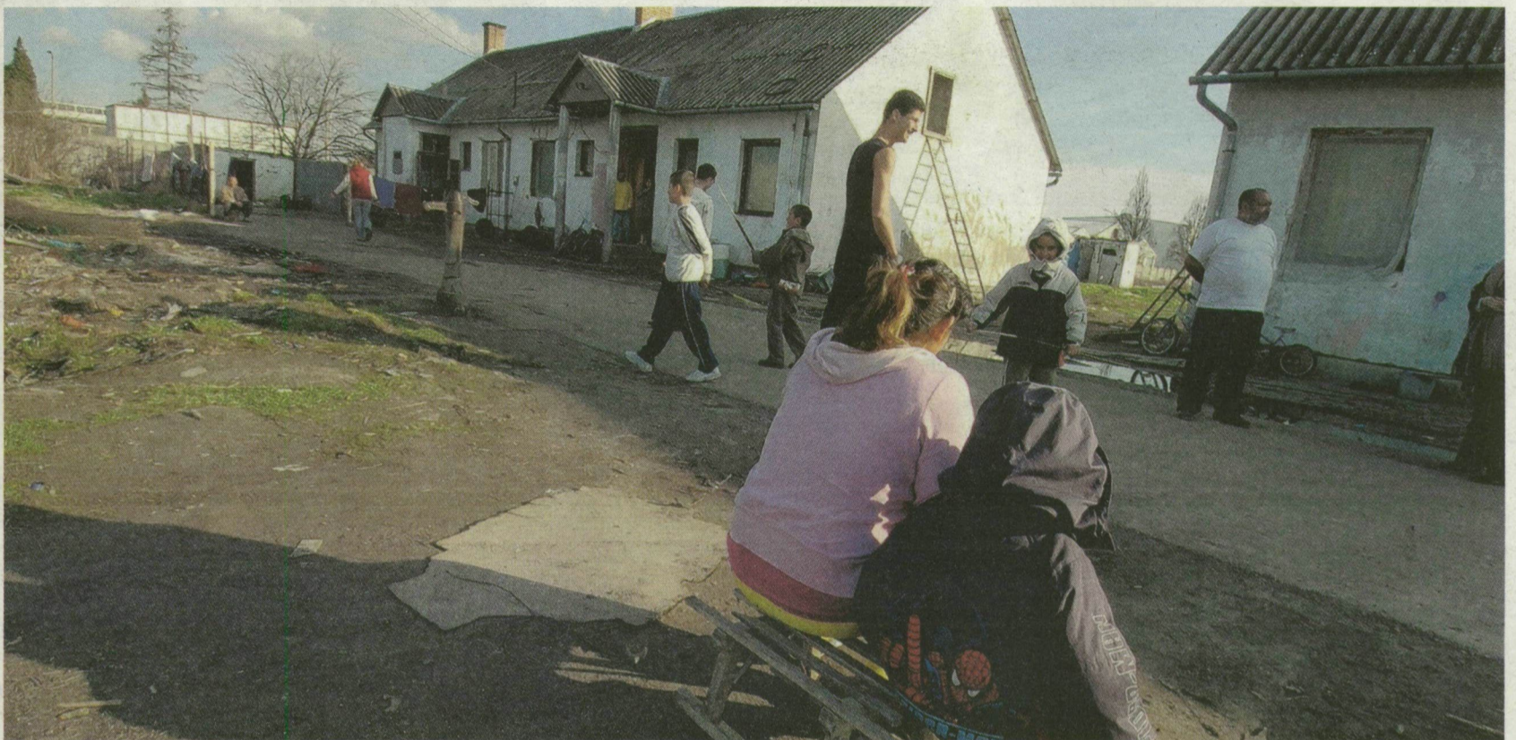
■ NEM MINDNYÁJAN ÉLNEK NEHÉZ KÖRÜLMÉNYEK KÖZÖTT. DE TÉNYLEG: PONTOSAN MENNYIEN?

A nyolc évvel ezelőtti népszámláláson 190 ezer magyar állampolgár vallotta magát cigány nemzetiségűnek. Egyes források egymillió roma népességről szólnak. Vajon hol az igazság? Kállai