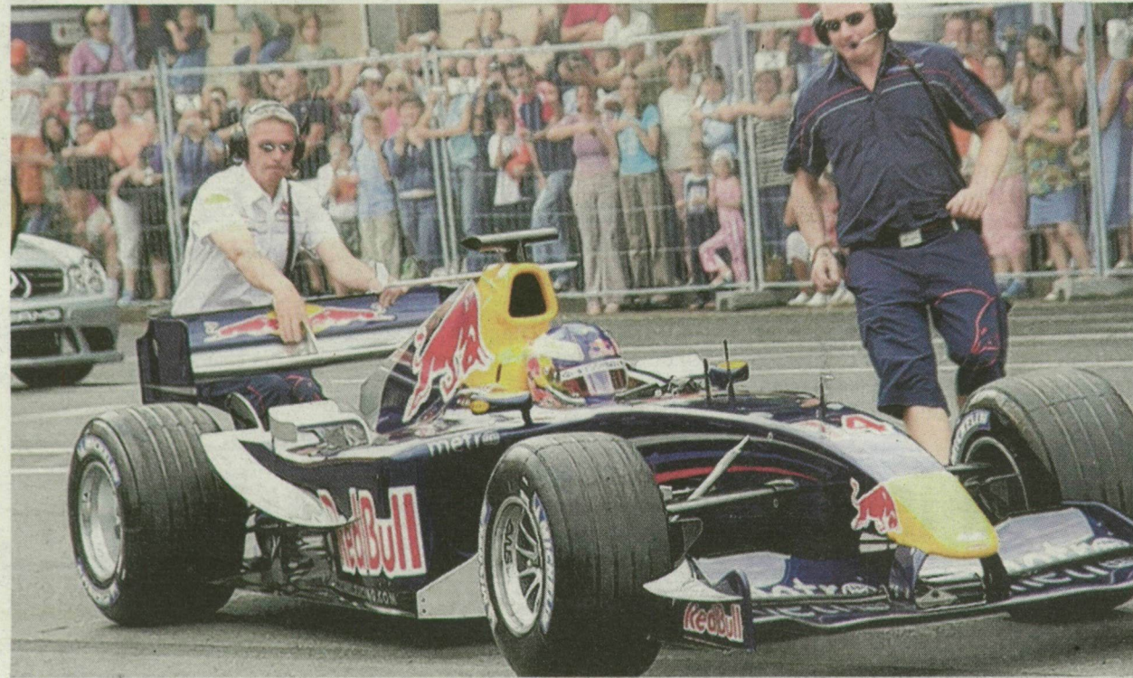
■ TAVALY SIÓFOKON VOLT HASONLÓ RENDEZVÉNY ÓRIÁSI ÉRDEKLŐDÉS MELLETT, AHOGY KÉPÜNKÖN IS LÁTSZIK. SEBASTIAN VETTEL F-1-ES PÍLÓTA ITT LESZ SZEGEDEN