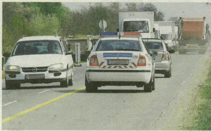
■ HATALMAS A FORGALOM, SOK A TÜRELMETLEN SOFŐR, NAGY A BALESETVESZÉLY A 47-ES FŐÚTON