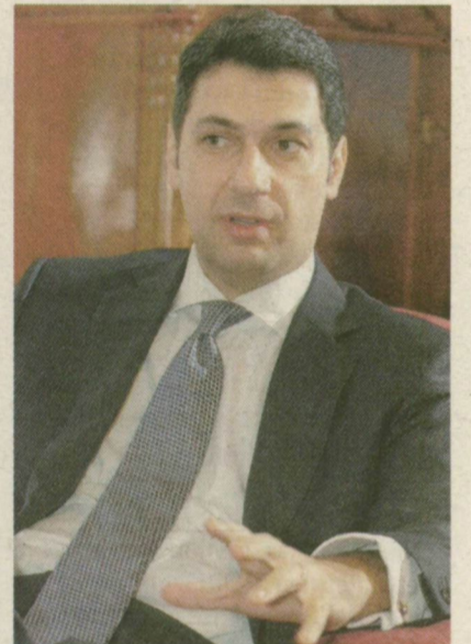
■ Lázár János kommunikatív politikus