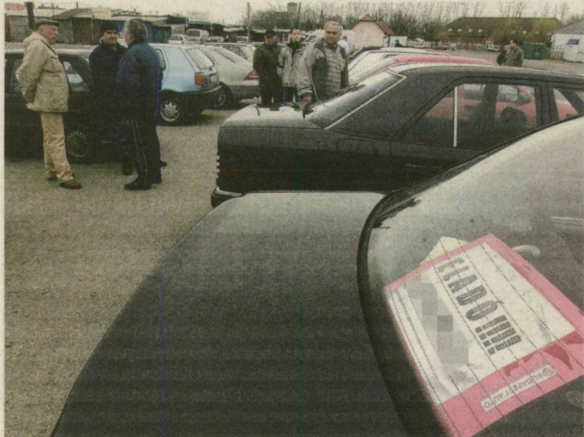
EGYRE TÖBB A NÉZELŐDŐ. A TAVASZ MEGHOZTA A HASZNÁLT AUTÓK IRÁNTI KEDVET A CSEREPESES SORI PIACON.

Érdeklődőkből a Cserepesen sem volt hiány. Üzlet azonban nemigen kötött, az emberek inkább csak tájékozódtak. Míg a kereskedésben a legolcsóbb használt autót 1,5 millió forint volt, itt már 125 ezerért is gazdát cserélhetett volna egy négykerékű. Több vevő bevallotta, hogy szívesebben vennének új járművet - hiszen a válság miatt azok ára is jelentősen csökkent -, de nincs elég tőkéjük hozzá, hitelt pedig ebben a bizonytalan légkörben életveszélyes lenne felvenni.