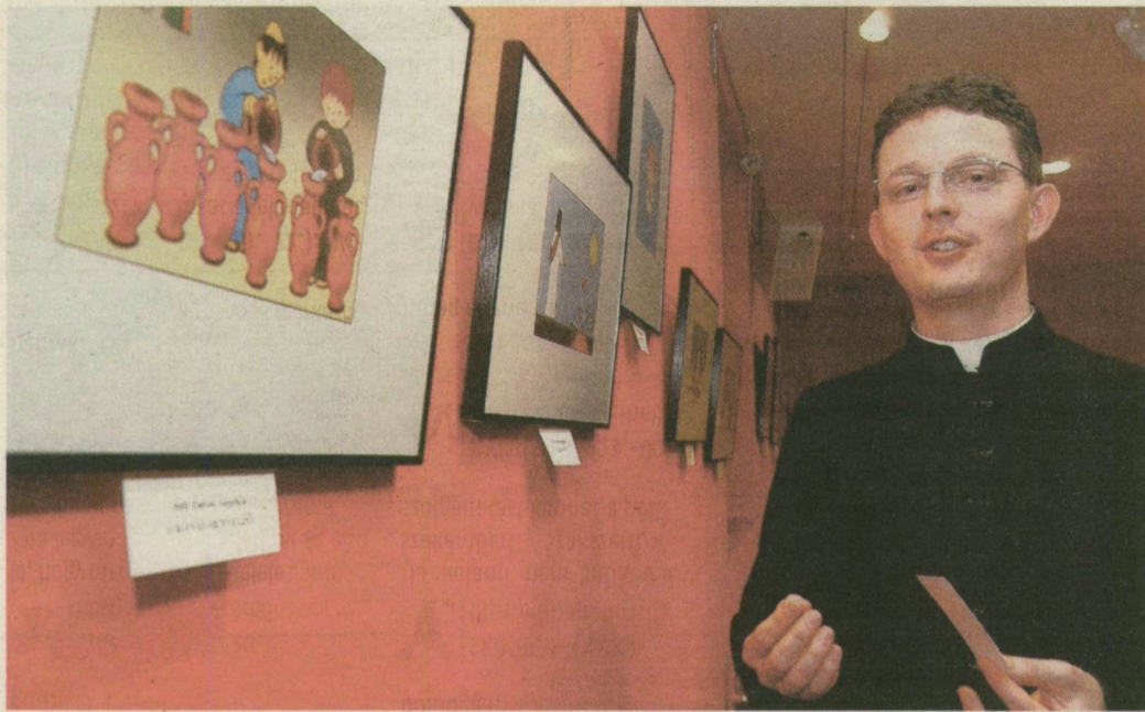
■ ZOLTÁN ATYA SZERINT KÉPEKKEL TÖBB DOLGOT EL LEHET MONDANI, MINT SZAVAKKAL