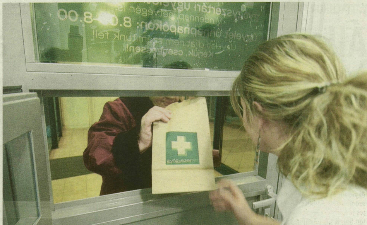
■ MINIMÁLIS AZ ÉJSZAKAI FORGALOM, NEM ÉRI MEG AZ ÜGYELET

A makói rendőrök elfogták a 27 éves fiatalembert, aki éjszakába nyúló kihallgatása során még hat makói kocsmá feltörését ismerte be. Huszonnyolc éves társa is kézre került. Őt azonnal börtönbe vitték, mivel elfogatóparancsot adtak ki ellene, ugyanis nem kezdte meg a jogerősen kiszabott szabadságvesztését.