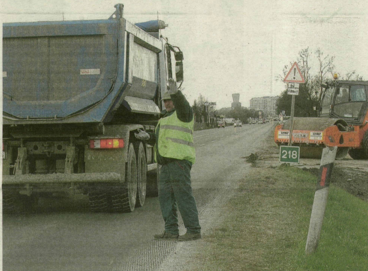
■ AZ M43-AS LEENDŐ FELÜLJÁRÓJÁNAK ÉPÍTÉSE MIATT A 47-ESEN AUTÓZÓK TORLÓDÁSRA SZÁMÍTHATNAK