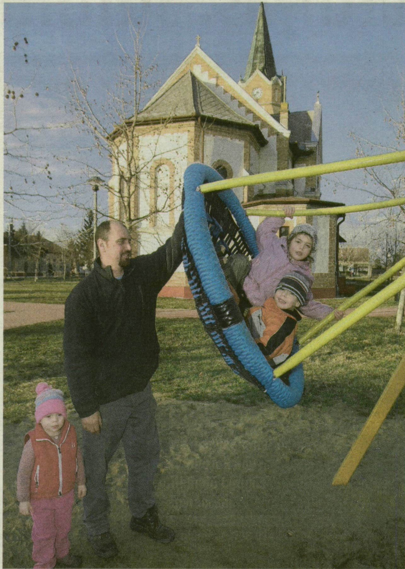
■ KORSZERŰ, BIZTONSÁGOS JÁTSZÓTÉR A FALUBAN