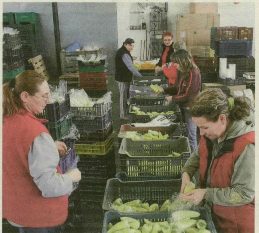
HITELFELVÉTEL NÉLKÜL FEJLESZT A SZENTESI DÉLKER-TÉSZ: CSARNOKOT BŐVÍT, ÉS TÖBB TUCAT MUNKAHELYET IS TEREMTENE

A jelenleg 63 főt foglalkoztató szövetkezet májustól 20-40 fővel bővítené a dolgozói létszámot: a csomagolást végző alkalmi munkavállalók helyére állandó munkaerőt venne fel, de ezt nehezíti, hogy a kormányzat a mezőgazdaságban nem támogatja az ilyen törekvéseket – tudtuk meg az elnöktől.