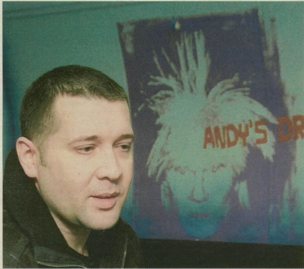
■ ÁCS GYÖRGYNEK KÖSZÖNHETŐEN KERÜLT WARHOL ARCKÉPE AZ EGYETEMI KLUB RUHATÁRÁBA