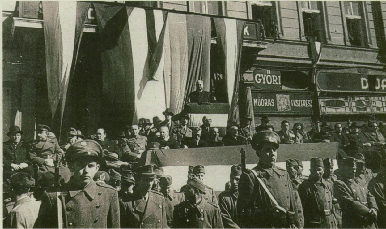
■ Március 15. 1945-ben. A tömegrendezvényt a centenáriumra újraértelmezték

Nemzeti színű keretben Petőfi Nemzeti dala, vörös fejléccel írjuk a címlapon: „Világ proletárjai egyesüljete!” Szent-Györgyi Albert „egyetemi nyilvános rendes tanár az élettan” terén elért eredményeiért részesült Kossuth-díjban. Az elismerést először osztják ki a centenáriumi ünnepen. A szegedi orvoskar „három Kossuth-díjat hódított el”: Jan-