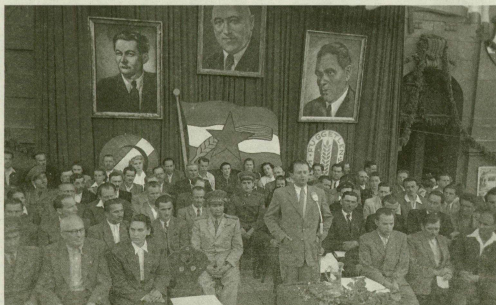
■ A nép hídjának nevezték az avatóünnepségen a Tisza új ékességét. A szegediek november 21-én vonulhattak az új közúti hídra

sabb elvégzésben” – írjuk november 17-én. „Elkészült a villamos felső vezetőke.” „Épül a tribün.” „Jöhet már a teherpróba!” „Vasárnap, november 21-én átadják Szeged közelebbi és távolabbi környéke lakosságának, az üzemekben, gyárakban dolgozó többi munkásnak, a jövő évi kenyérükért harcot folytató dolgozó kisparasztnak és az irodák, intézmények haladó értelmiségének”.