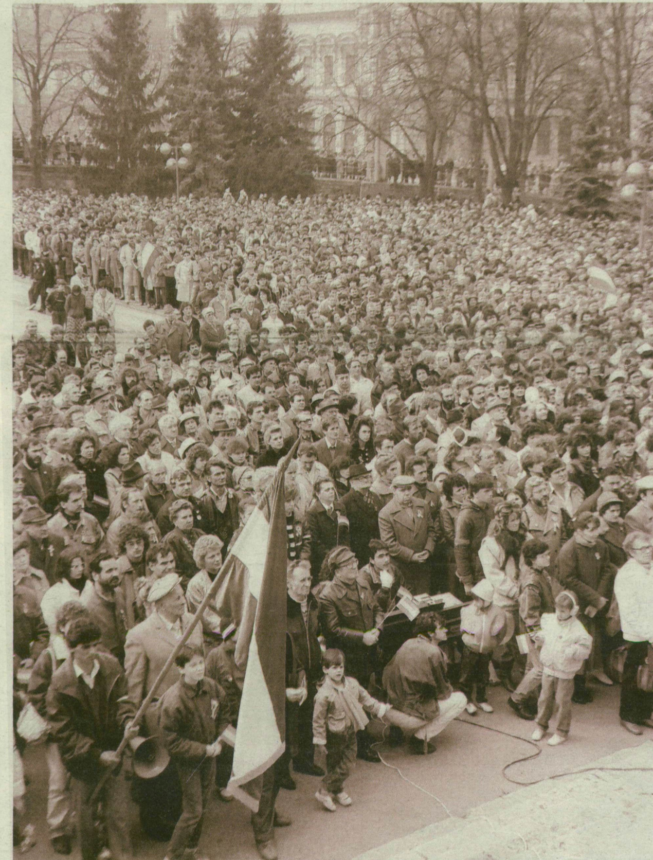
■ 1989. MÁRCIUS 15., MÓRA PARK. ITT KEZDŐDTEK A NEM HIVATALOS, RENDSZERVÁLTÓ ÜNNEPI ESEMÉNYEK