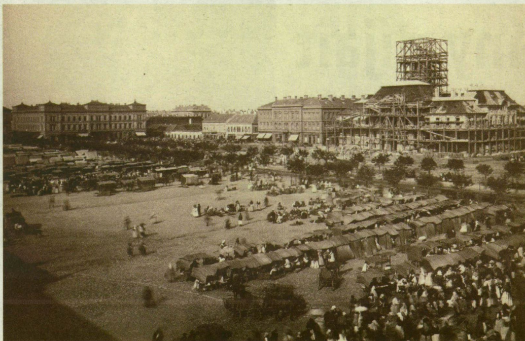
■ A SZÉCHENYI TÉRI PIAC, MÖGÖTTE AZ ÚJJÁSZÜLETŐ VÁROSHÁZA

A hazai gyűjtések 1 millió forintot hoztak. Az európai szintű összefogás az újjáépítés költségeinek egytizenhatodát fedezte. Olyan személyiségek is adakoztak, mint a három koncertje 1900 forintnyi bevételét fölajánló Liszt Ferenc, vagy a könyvtárát ide ajándékozó Somogyi Károly. Kossuth Lajos meg 550 arany frankot csatolt leveléhez, melyben azt üzenté