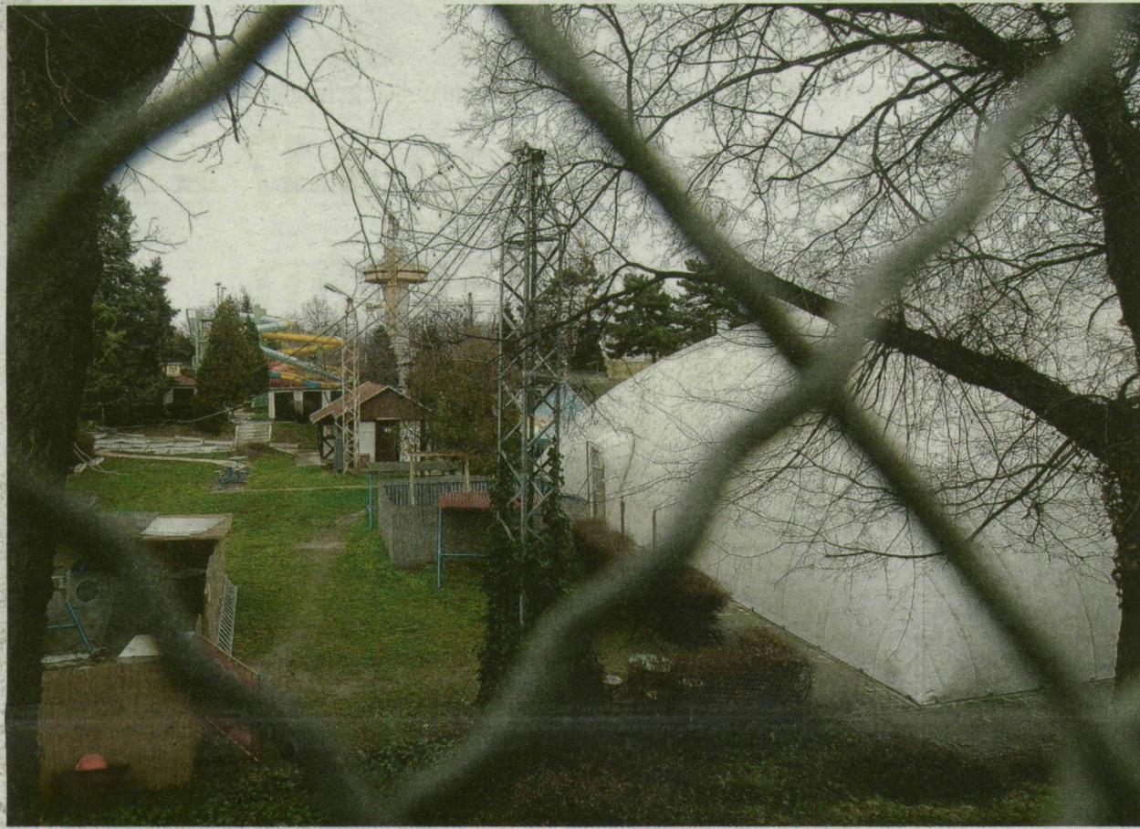
A SZUE MOST. AZ ÉPÍTÉKÉZÉS MIATT IDE NEM MEHETNEK BE A VENDÉGEK AZ IDEI NYÁRON