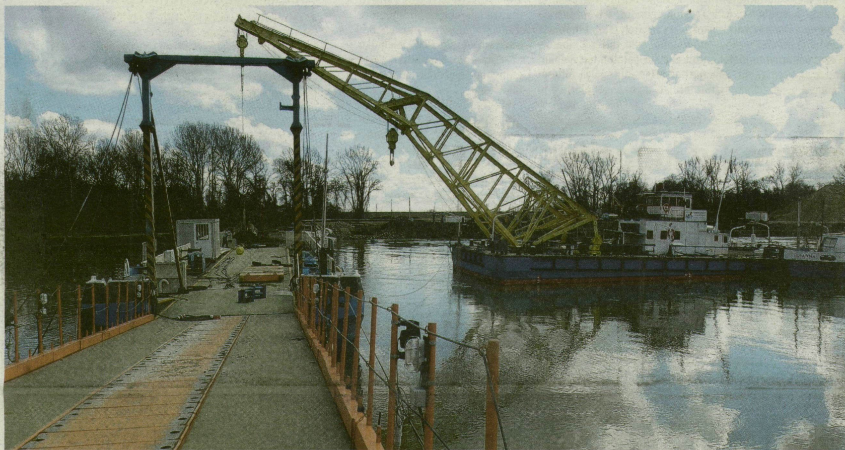
■ AZ USZÁLYHÍDRA AZÉRT VAN SZÜKSÉG, HOGY ÁTKELHESSENEK A FOLYÓN AZ ÉPÍTÉZÉSRE IGYEKVŐ JÁRMŰVEK