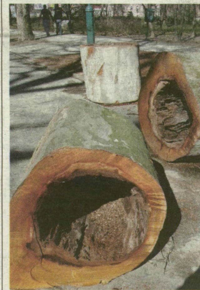
■ EBBEN A TÖRZSBEN TANYÁZTAK A DENEVÉREK