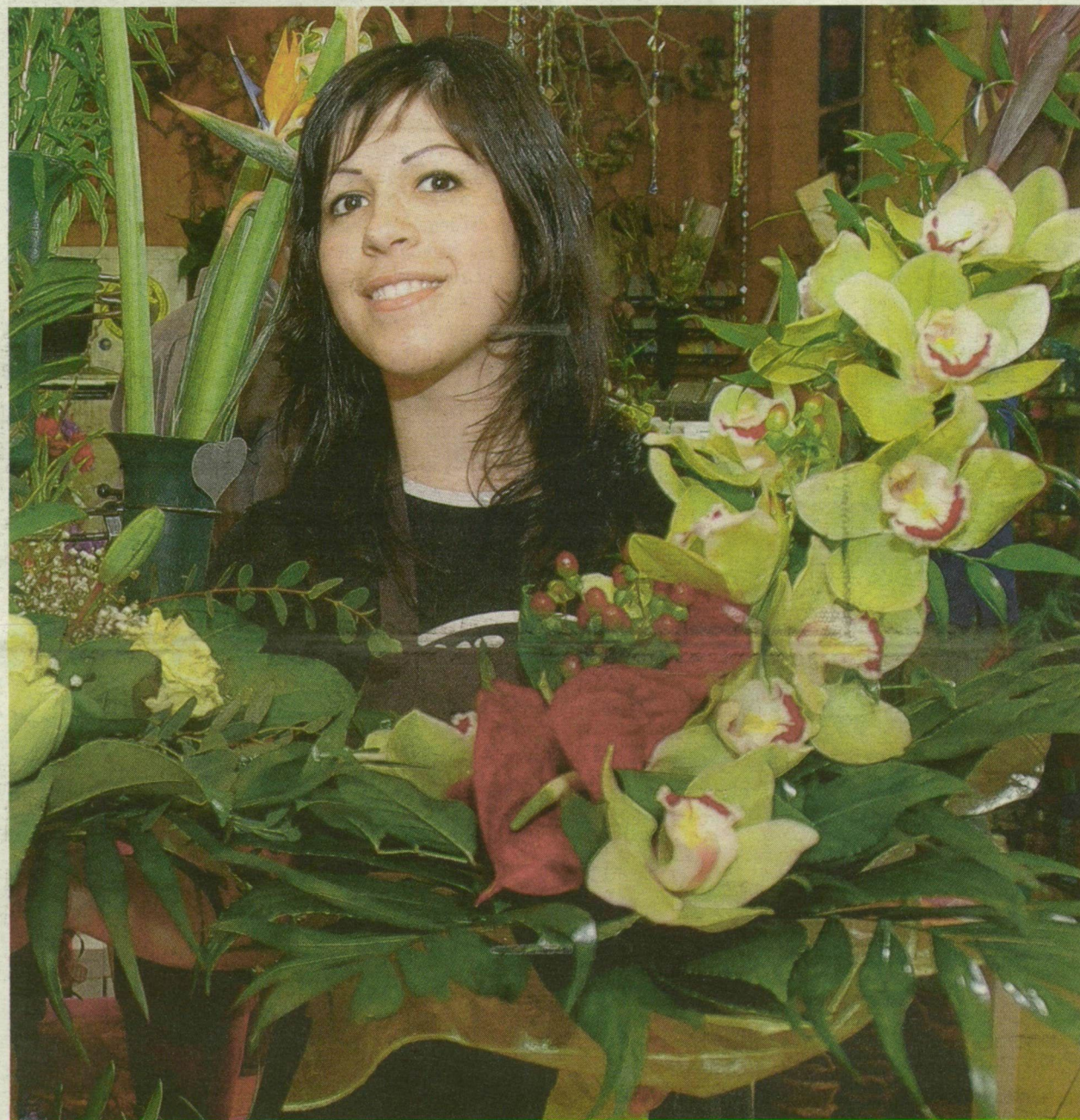
■ SZEGEDI VIRÁGÖZÖN. AZ ILYEN TEKINTETEK TŐL VARÁZSOLÓDNAK EL A FÉRFIAK