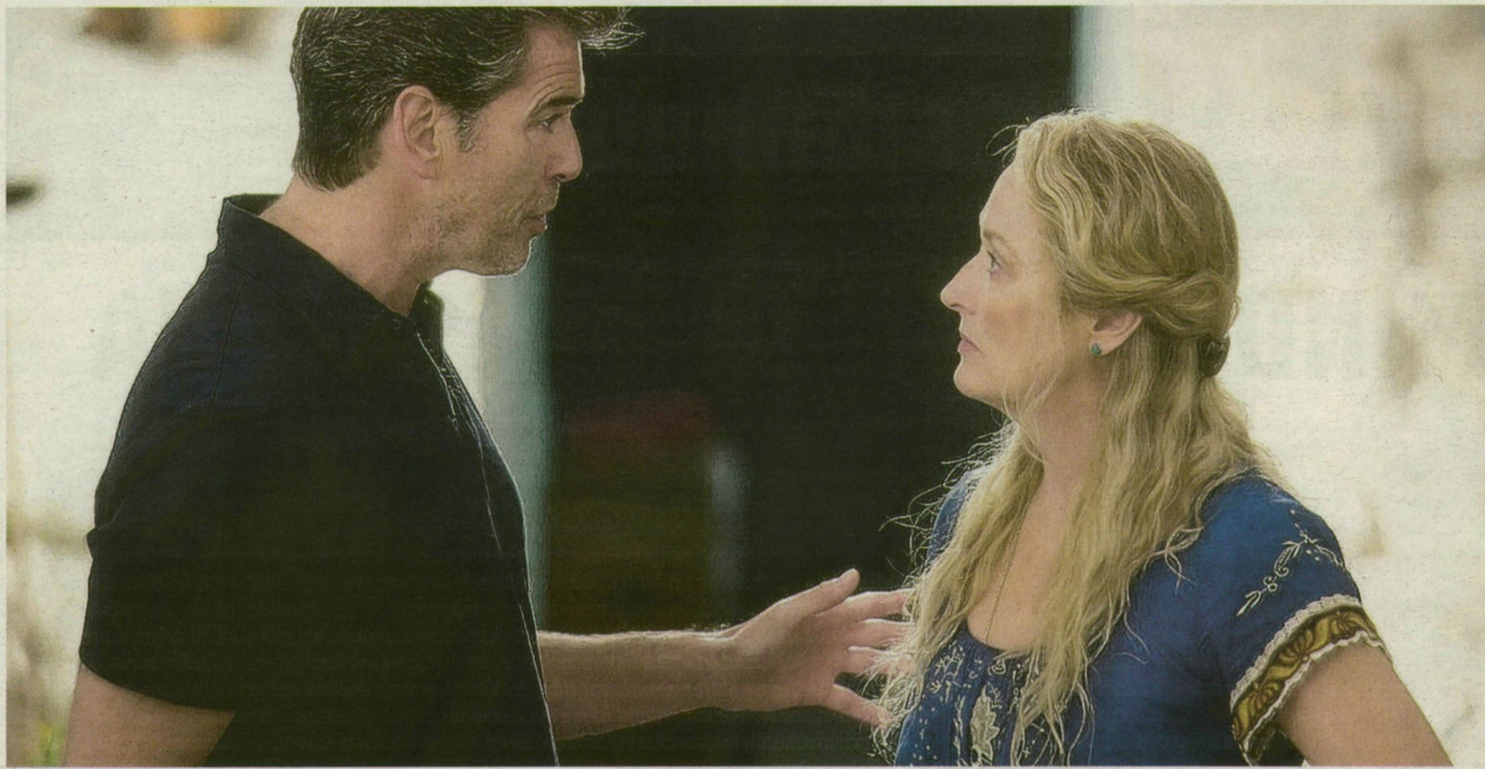
■ MAMMA MIA!: A TAVALI NYÁR PARTIFILMJE VILÁGSZTÁROKKAL – NEM CSAK NŐKNEK. KÉPÜNKÖN A KÉT FŐSZEREPLŐ, PIERCE BROSAN ÉS MERYL STREEP