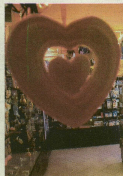
CSENDELÉT AZ EGYIK SZEGEDI SEXSHOPBAN