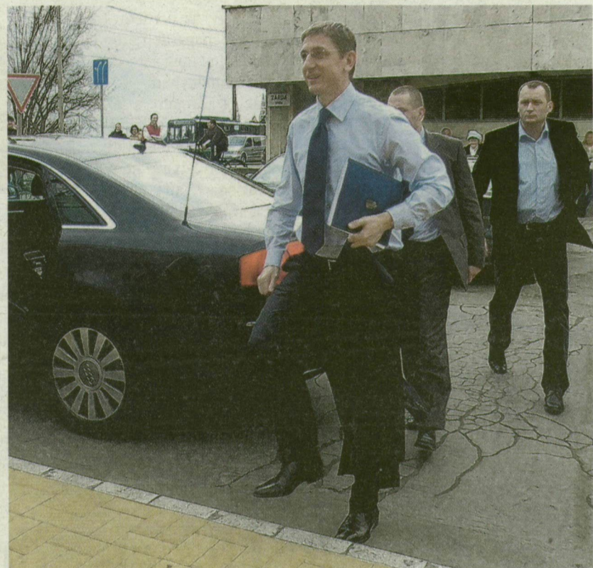
A KORMÁNYFŐ MEGÉRKEZIK SZEGEDRE – OLDALRÓL KÖZELÍTETTE MEG AZ IH RENDEZVÉNYKÖZPONTOT