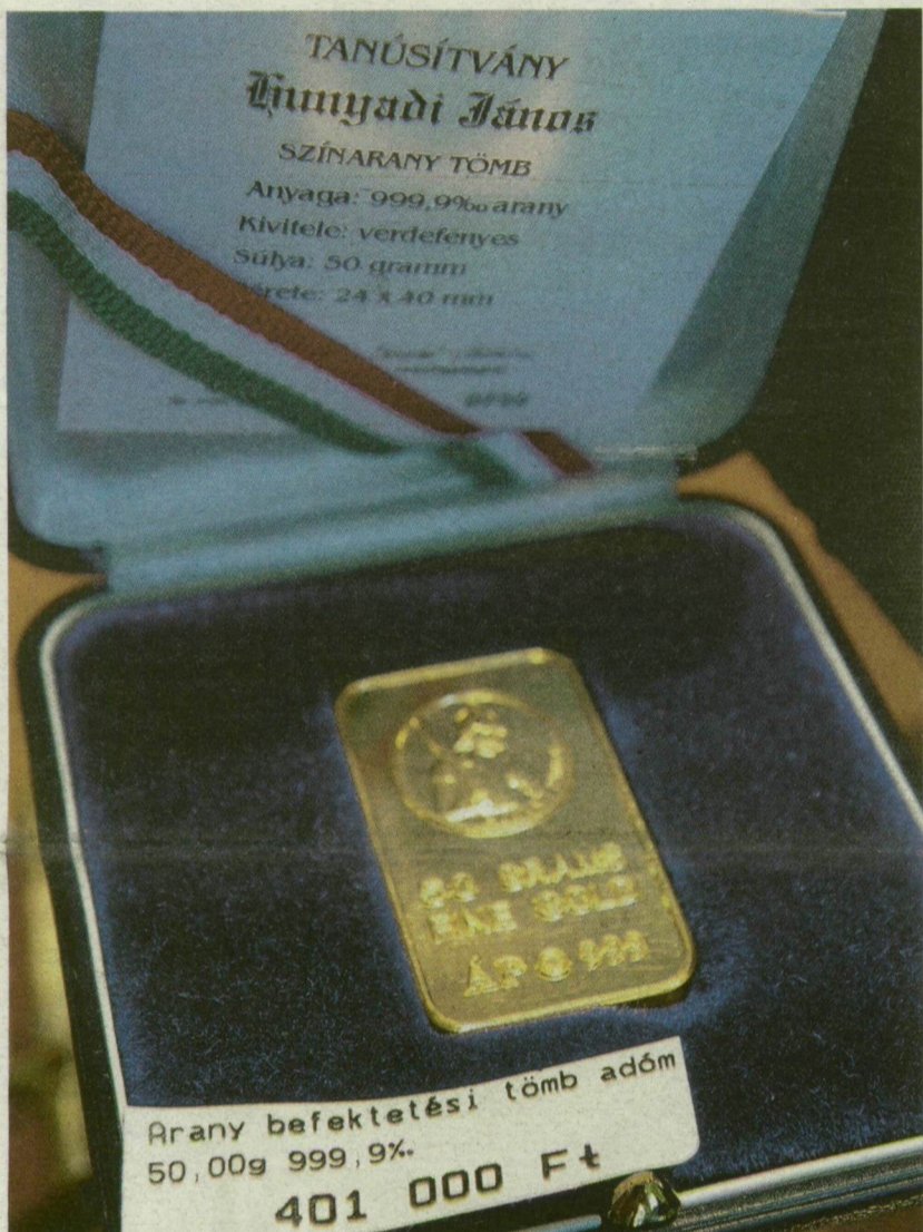
EZT AZ EGY ARANYTÖMBÖT TALÁLTUK, A TÖBBIT MEGVETTÉK