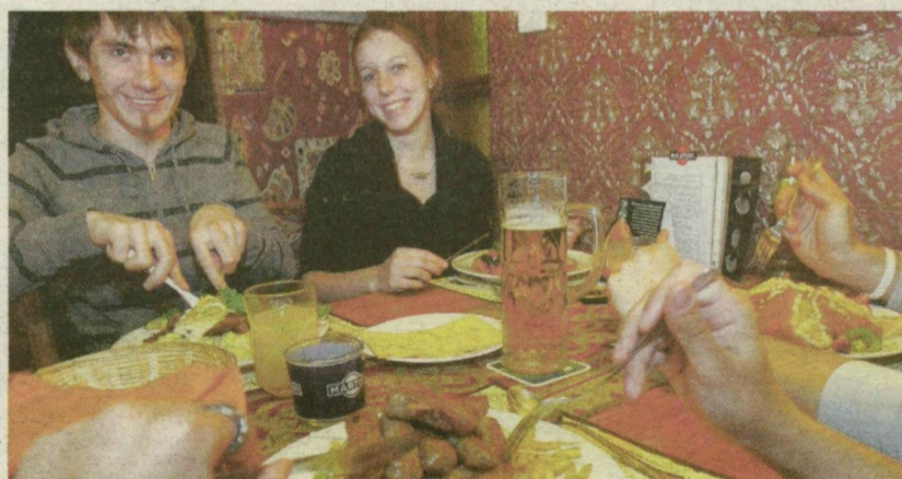
FÉLÁRÚ FINOMSÁGOK A SIESTA ÉTTEREMEN

Még láttunk néhány szabad asztalt, amikor tegnap ebédidőben beléptünk Szegeden az Attila utcai Siesta étterembe. Ez a vendéglő is csatlakozott a Torkos csütörtöki akcióhoz, azaz fél áron ehetett-ihatott egy napig mindenki. A pult