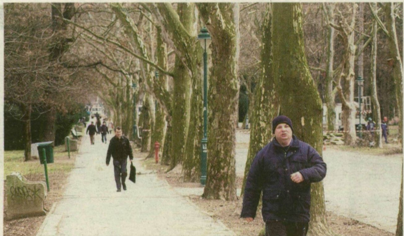
A JÁRÓKELŐK JÓ ÖTLETNEK TARTOTTÁK AZ ELNEVEZÉST