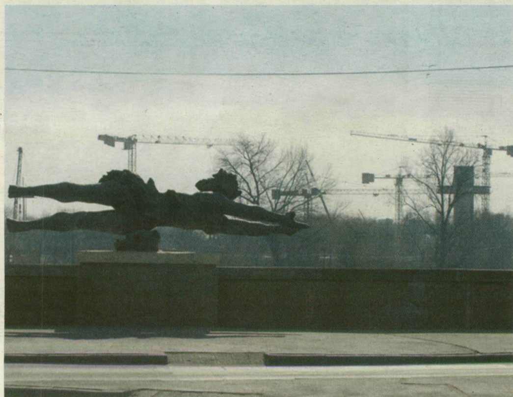
■ ÚJSZEGED ÚJABBAN ÍGY NÉZ KI A SZEGEDI OLDALRÓL, A TISZA-SZOBOR FELŐL