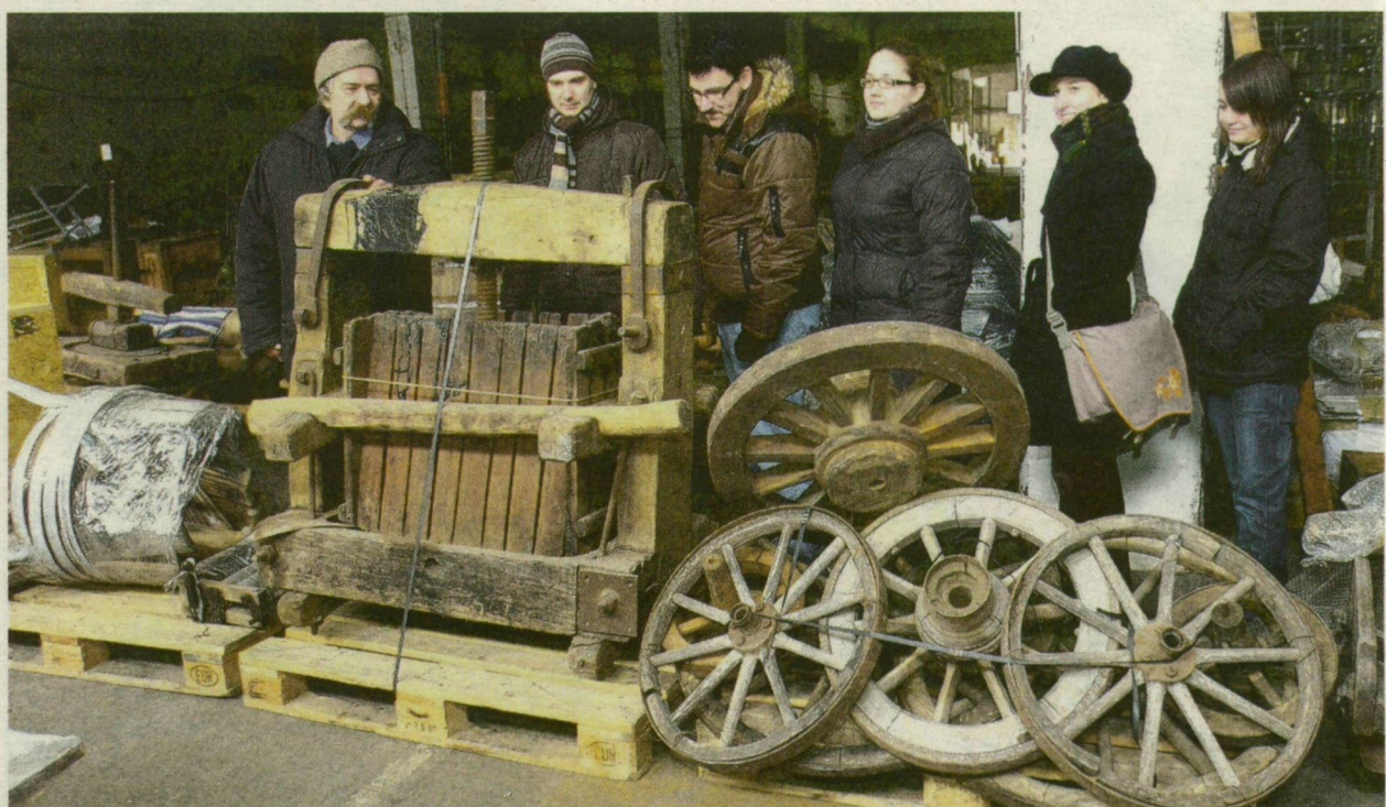
A LEGNAGYOBB HELYET A NÉPRAJZI GYŰJTEMÉNY FOGLALJA EL

vel. Az új, végleges raktárbázis helyéről és felépítéséről még tárgyal a múzeum.