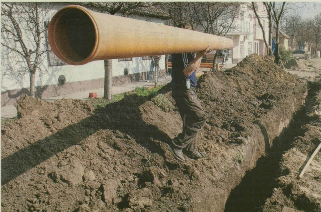
A CSATORNAÉPÍTÉS DRÁGA BERUHÁZÁS, EZÉRT A KFT. AJÁNLATA TETSZETT A SZEGÉNY ÖNKORMÁNYZATOKNAK Illusztráció: Karmok Csaba

A bomba évek óta ketyeg, most robbant. Az elmúlt hetekben ország-